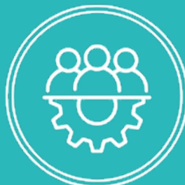
Développement de l'entreprise