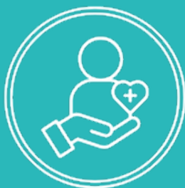
Sanitaire & Social